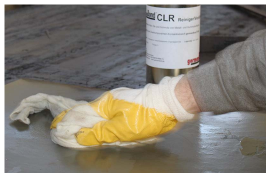
(к п.3. – очистка контактного слоя)

4. После высыхания: Выполните первое нанесение контактного клеящего вещества. Соблюдайте инструкцию по обработке для клеящего вещества germanBond® 4kR.