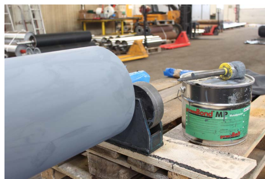
(к п.3. – после нанесения усилителя адгезии)

4. После высыхания усилителя адгезии (не менее 30 минут) выполните первое нанесение контактного клеящего вещества. Соблюдайте инструкцию по обработке для клеящего вещества germanBond® 4kR.