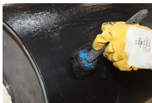
(к п.4. – первое нанесение контактного клеящего вещества)