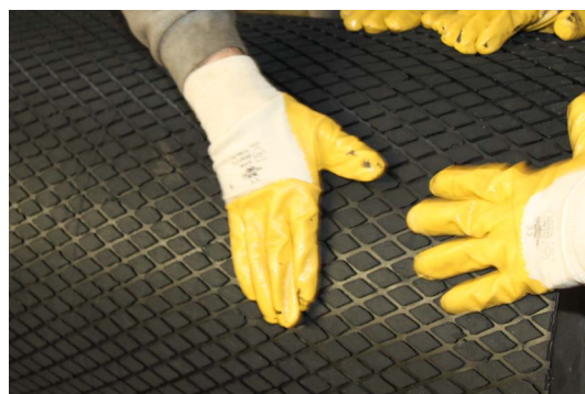
(к п.3. – придавливание футеровки)